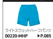
ライトスウェットハーフパンツ 00220-MHP ▶P.085