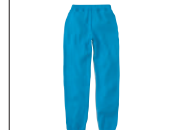
ライトスウェットパンツ 00218-MLP ▶P.085