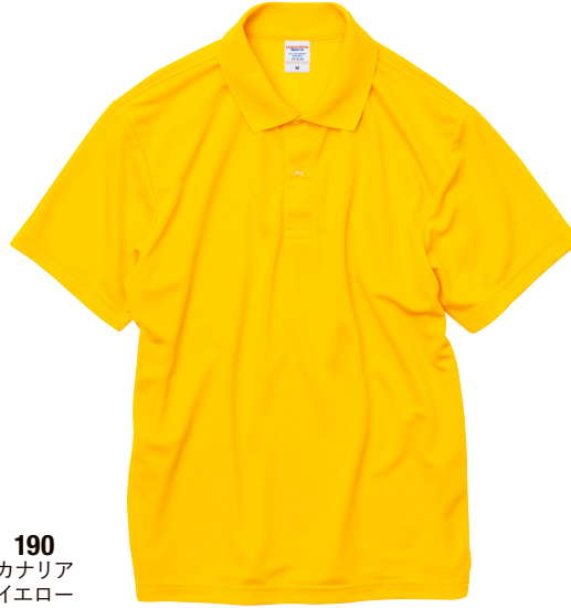
190 カナリア イエロー