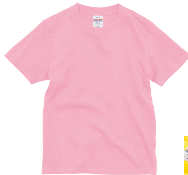
5001-02 066 ピンク