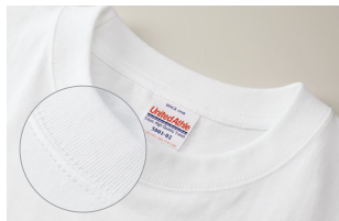
5001-02 首リブアップ ※90cmサイズはステッチなしの樹脂製スナップボタン仕様