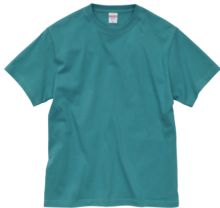
5001-01 935 ヘイジークリーン