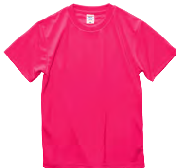
5900-02 114 蛍光ピンク