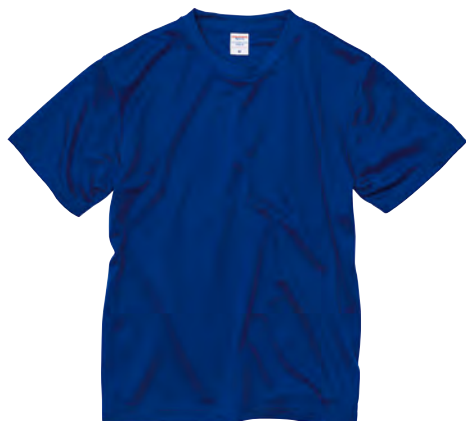
5900-01 095 マリン ブルー